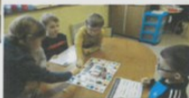
Un jeu de société avec les familles des aliments