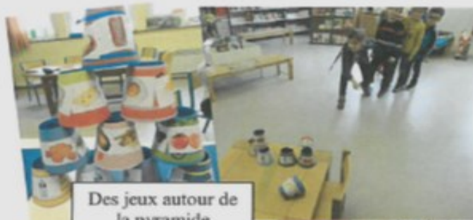
Des jeux autour de la pyramide alimentaire.