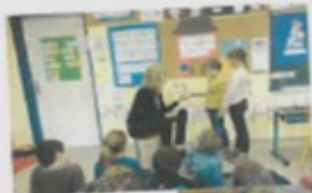
La préparation de repas équilibrés