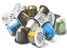
Dosettes de thé et café