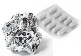
Papier aluminium blisters médicaments