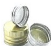
Bouchons en métal