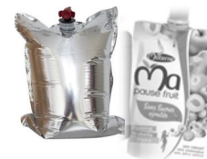
Sachets et poches