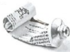
Tubes de crème