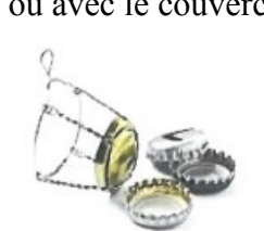
Capsules de bouteilles

En plus des bouteilles et flacons en plastique, papiers et cartons, briques alimentaires et acier et aluminium (boîtes, aérosols,...) viennent se rajouter les déchets ci-dessous à mettre dans le bac de tri (poubelle bleu ou avec le couvercle jaune).