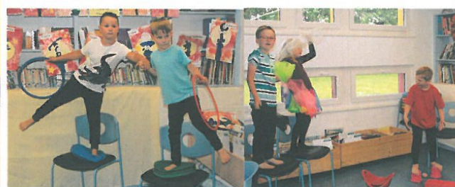
Les équilibristes et jongleurs