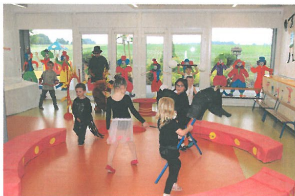
Les contorsionnistes, dompteurs, écuyer et hommes forts