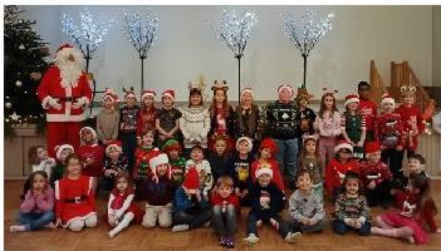
Venue du Père-Noël