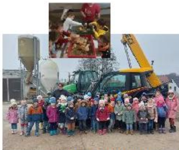
Visite de la ferme Arnold