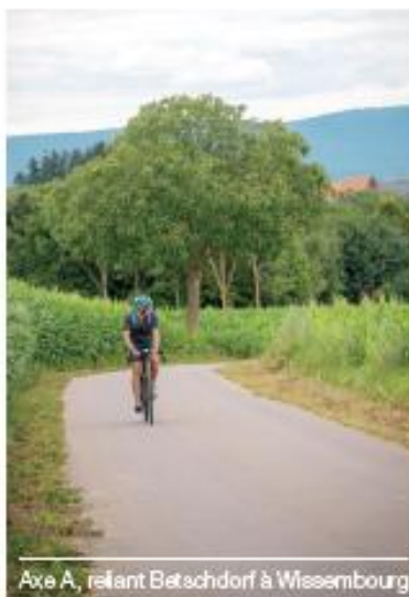
Axe A, reliant Betschdorf à Wissembourg

Des travaux ambitieux qui représentent un investissement conséquent, avec un coût de 2,8 millions d'euros pour l'Axe A et 2,2 millions d'euros pour l'Axe B, soutenus à hauteur de 50% par la Collectivité.