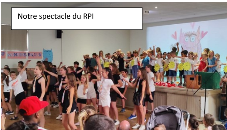
Notre spectacle du RPI